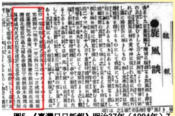
圖5 《臺灣日日新報》明治37年(1904年)7月22日第5版旋風談中提到光緒四年的旋風對臺南的影響。

(三)、事件文史報導資料分析:1904年灣裡旋風造成的災害依臺灣測候所統計,今台南區、安定區及灣裡區共有16庄傳出災情,死亡人數5人,輕重傷共80人。房屋全毀共有245棟、部份損壞354棟。傷亡損害最重的是:本淵寮76棟全毀,4人死亡,30人受傷;灣裡街全毀68棟,但半毀則有241棟,受傷人數則20人;巷口庄51棟全毀,53半毀,11人輕重傷。灣裡支廳廳長的官舍也被風翻倒。在這個旋風事件中,《臺灣日日新報》還特別追溯了臺灣歷史重大的旋風,其中提到光緒四年(1878年)的臺南旋風紀錄(圖5)。