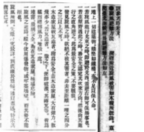
圖6 《臺灣日日新報》明治37年(1904年)7月23日第三版旋風避難方法。

《臺灣日日新報》訪問臺北測候所所長,並在報紙中提供避難方式。如:「地上的建築物,雖堅如鐵箱,但不足保命。」「若旋風進行北東就要避在北西。」透過報紙宣導,讓民眾對旋風有防災知識(圖6)。另外,在媒體報導中也提到旋風發生前臺南測候所的氣壓在四點多曾下降,到晚上八點才恢復正常的氣壓(圖7)。而在中央氣象局臺灣南區氣象中心所保存的臺灣測候所氣象月報中,也可看到明治37年(1904年)7月18日當天每四小時一筆的氣壓紀錄(圖8),正好可與當時媒體報導的內容進行相互比對。