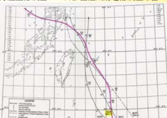
圖3 明治37年(1904年)7月12-14日B026號颱風逐時路徑圖。

依據侵臺颱風資料庫(2020)的資訊,1904年7月14日B026颱風從臺灣北部海面通過(圖3),颱風接近臺灣時南部降雨並不明顯,但15日颱風遠離後,降雨反而比14日更多,17日的日累積雨量更有217.1 mm,顯見在颱風遠離後,南部在偏南風暖溼空氣影響下天氣反而更不穩定,也造成龍捲風的產生。另外,在臺南氣象中心保存的氣象月報中,明治37年(1904年)7月14日-19日都記錄著天氣是受到暴風的後續影響(圖4)。