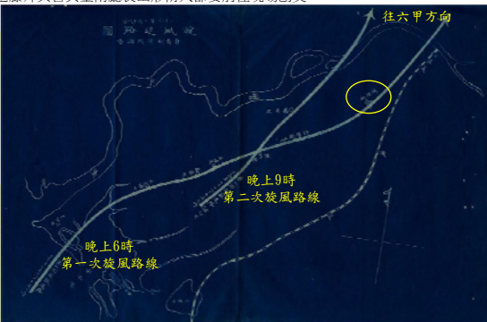
圖1 從「旋風進路圖」可知旋風通過灣裡街(今善化)附近。黃圈處為灣裡街。(取自:《灣裡街附近通過之旋風風況臺灣測候所長報告》)。

(一)、事件概述(圖1):1904年7月18日傍晚5點多至6點,今臺南安平海面西北方向突然間捲起一陣漏斗狀的旋風,穿過四草,沿著曾文溪南往今臺南本淵寮聚落前進。其後旋風快速掃過新寮庄、中州寮庄、安定區中溝、安定港口庄。再沿著許厝寮(應為今安定許中營)到灣裡街(今善化)。灣裡的災情十分慘重。旋風從形成到越過曾文溪後消失於今臺南六甲區,其時間短短20-25分鐘左右,卻造成當時安平支廳及善化支廳(今台南、安定、善化地區)極大的災害。當天其實共有兩個旋風,一個是傍晚6點10分到達灣裡的旋風;同天晚上9點,第二個旋風形成於新宅庄附近,經過港口庄往嶺脚庄方向越過曾文溪後消失,還好只是一個小型旋風。對同一天遭遇2個旋風的港口庄民來說,這天真是飽受驚嚇不已。因為災害重大,臺南測候所所長遠藤外與吉與臺南廳長山形脩人等都要前往現場勘災。